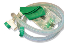
V913415 + V1281102