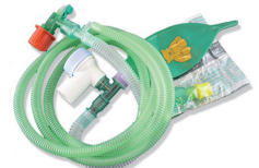
V913416 + V923073